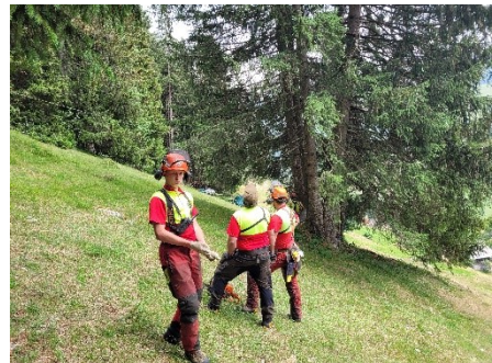
Abbildung 2 Besprechung für die Fällung einer Baumgruppe

Gelerntes: Sobald der Fallkerb aus dem Baum geschnitten wird, darf man nicht mehr in der Gefahrenzone sein. Beim Benutzen der Seilwinde bleibt man ausserhalb des Seilwinkels. Vor einer Fällung überlegt man, wohin man flüchten kann und macht den Weg wenn nötig frei.