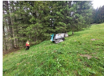
Abbildung 1 Felix umplatzieren mit Chrigu

Gelerntes: Weg-Räumung, Seilbahnholzschlag-Theorie