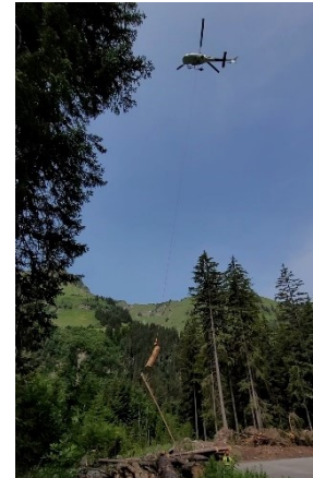
Abbildung 5 Abladeplatz mit Helikopter in Aktion

Gelerntes: Funktion Metallstruppen für Stämme, wie man sie löst und befestigt.