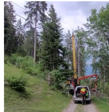
Abbildung 6 Abgespannter Gebirgsharvester