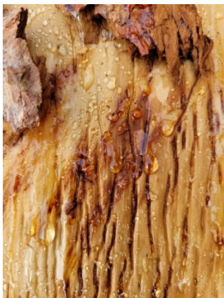
Abbildung 4 Harz bei einer Baumverletzung